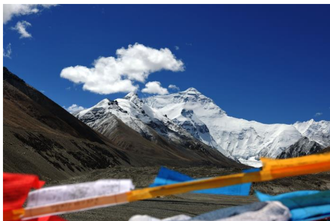
Base Camp des Mount Everest

Frühstück, anschließend Fahrt nach Dingri . Sie fahren über das tibetische Hochland nach Dungri , einer kleinen Siedlung in der Nähe des National-Parks, der den Mount Everest umgibt. Bei guter Sicht können Sie den höchsten Berg der Erde bereits in der Ferne sehen. Abendessen und Übernachtung im Hotel Tingri Everest.