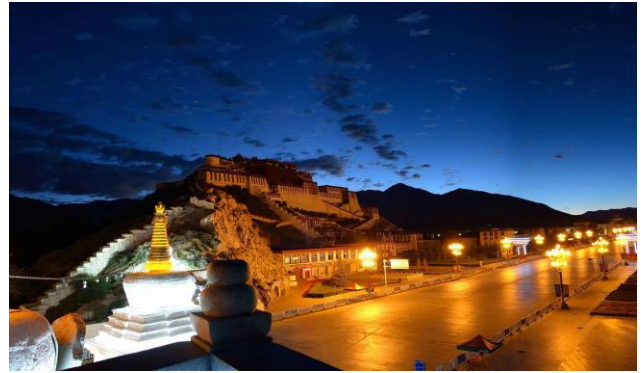
Potala-Palast in Lhasa die ehemalige Winter- residenz des Dalai Lama