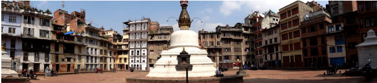
Kathmandu - Patan, der älteste Stadtteil von Kathmandu

Frühstück. Über den Himalaya-Hauptkamm fliegen Sie in einem spektakulären Flug unglaublich nah am Mount Everest vorbei von Lhasa nach Kathmandu, der Hauptstadt Nepals . Anschließend erfolgt ihr Transfer zum Hotel. Es ist Gelegenheit zu einem kleinen Rundgang durch das historische Zentrum Kathmandus mit seinen pulsierenden Basarstraßen. Abendessen und Übernachtung im Hotel Ambassador.