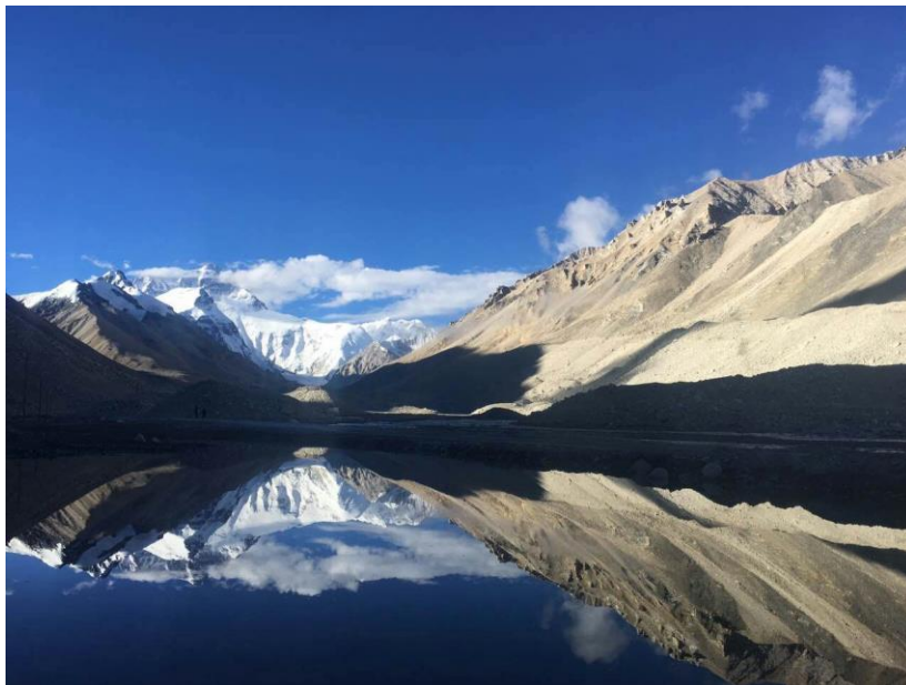
Yamdruk - See

Heute fahren Sie nach dem Frühstück von Dingri nach Shigatse (ca. 5 Stunden Busfahrt). In Shigatse angekommen, besichtigen Sie das Kloster Tashilhunpo , historischer Sitz des Panchen Lama . Besonders beeindruckend sind die riesigen mit Gold bedeckten Grabmale der Panchen Lamas sowie die große zentrale Versammlungshalle. Abendessen und Übernachtung im Hotel Tingri Everest.